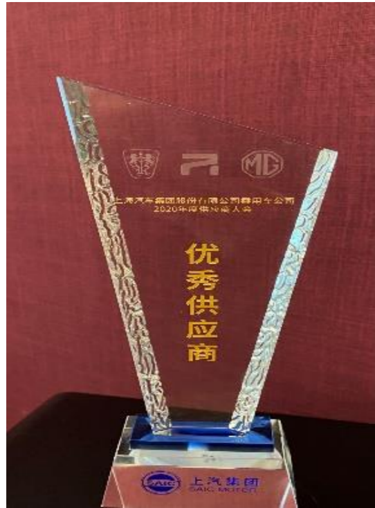
Excellent Supplier 2020Y (SMPV) 2020年度优秀供应商 (上汽乘用车)