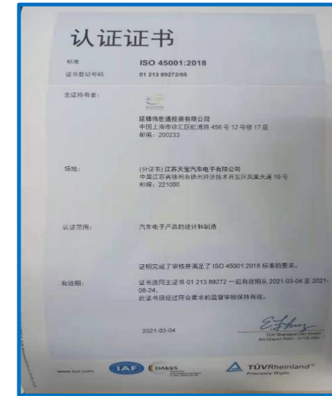
ISO 45001: 2016 职业健康和安全管理体系证书