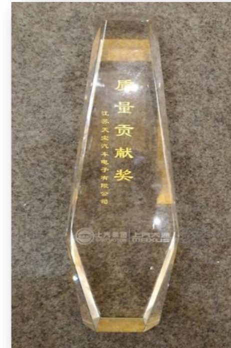
Quality Contribution Award 2019Y (SMCV) 2019年度质量贡献奖 (上汽大通)