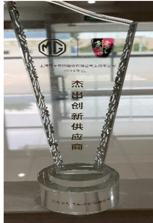
Outstanding Innovation Supplier 2019Y (SMPV) 2019年度杰出创新供应商(上汽乘用车)